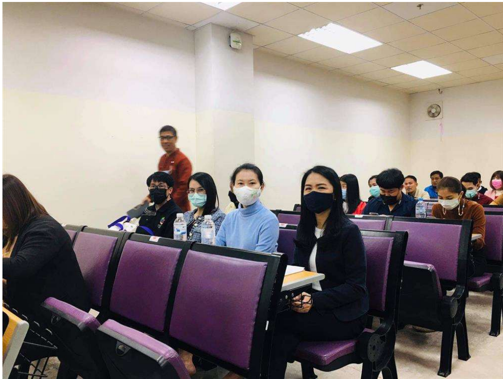
ภาพ 6 การอบรมให้ความรู้เรื่องการค้าแยกขยะให้กับบุคลากร