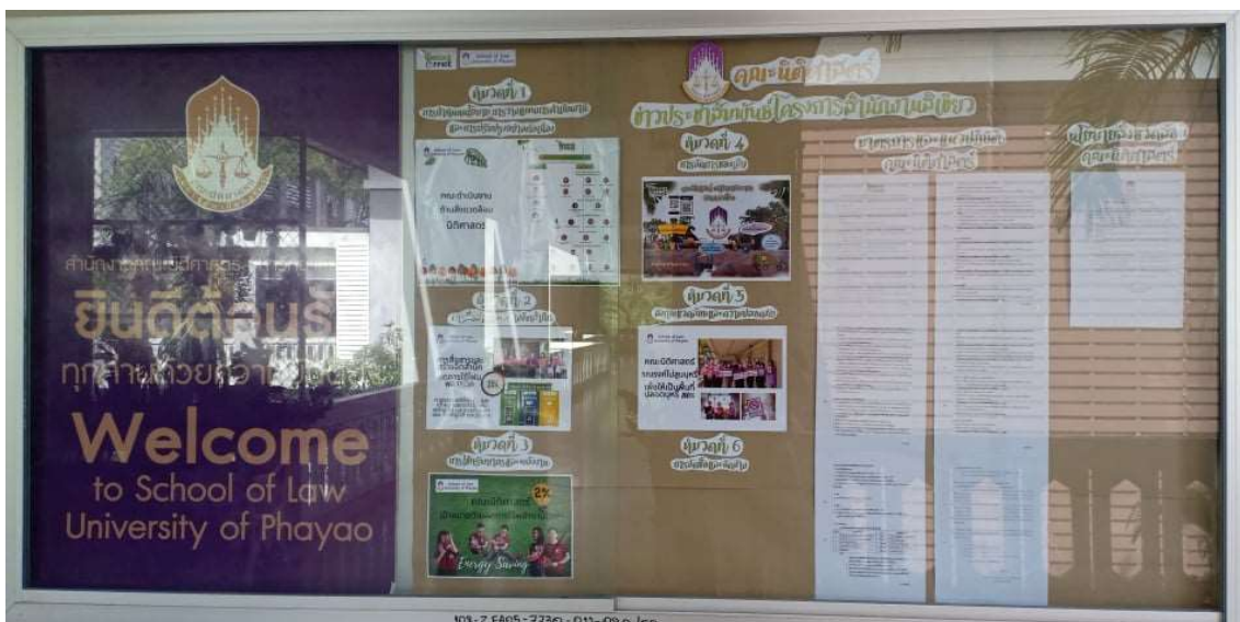
ภาพ 3 การรณรงค์สร้างจิตสำนึกการคัดแยกขยะผ่านบอร์ดประชาสัมพันธ์

2. ให้ความรู้การคัดแยกขยะ การนำขยะไปใช้ประโยชน์ และการรณรงค์ทิ้งขยะให้ตรงถังขยะแยกประเภทที่กำหนดให้ พร้อมทั้งรณรงค์ใช้บุคลากรในสำนักงานใช้กระเป๋าผ้าเพื่อลดการใช้ถุงพลาสติก คณะฯ ได้จัดประชาสัมพันธ์ ผ่านบอร์ดประชาสัมพันธ์ของสำนักงานคณะฯ และช่องทางสื่อสารต่างๆ เช่น Facebook และ Line เป็นต้น