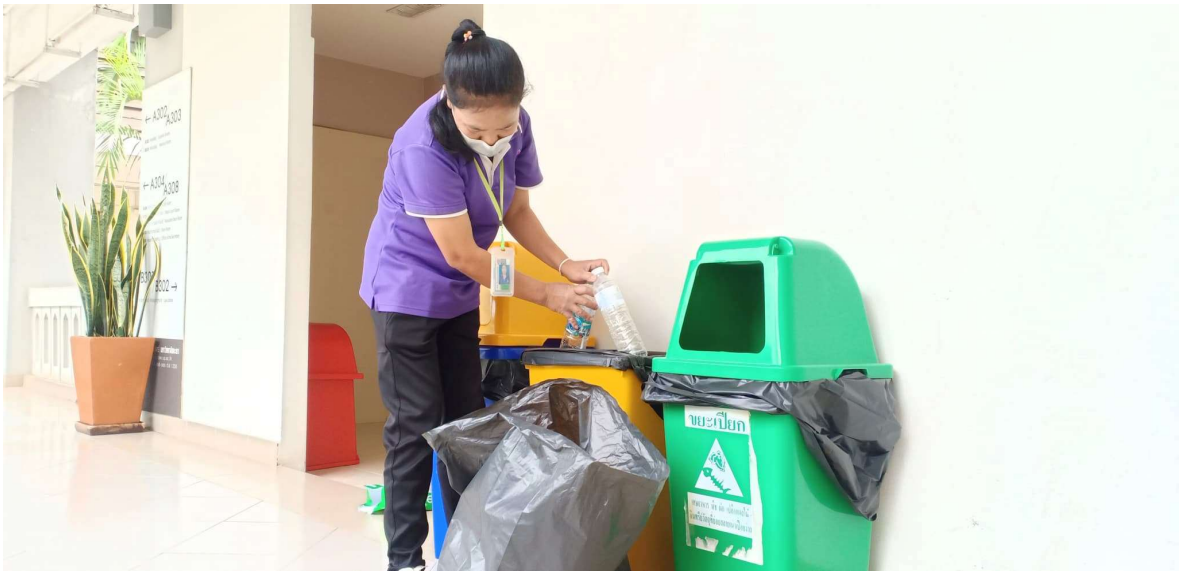
ภาพ 9 การตรวจสอบการทิ้งขยะ