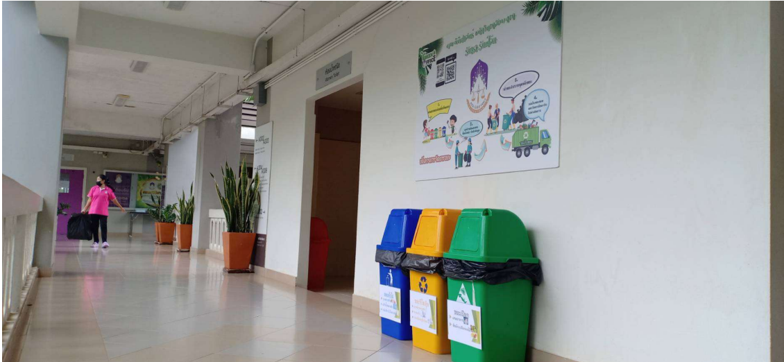
ภาพ 2 ถังขยะแยกประเภทภายในอาคาร

1. ได้มีการวางจุดทิ้งขยะภายในอาคารและมีถังขยะแยกตามประเภทของขยะ เพื่อสร้างจิตสำนึกของบุคลากรและการมีส่วนร่วมของผู้ที่มาใช้บริการ