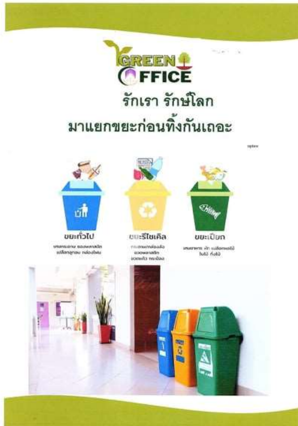
ภาพ 4 การประชาสัมพันธ์และรณรงค์ให้บุคลากรทิ้งขยะให้ถูกประเภทผ่านสื่อออนไลน์

เรียน บุคลากรคณะนิติศาสตร์ทุกท่าน 😊😊 ขอความร่วมมือบุคลากรทุกท่าน ทิ้งขยะให้ถูกถังถูกประเภทนะคะเพื่อลด ปริมาณขยะค่ะ.. 🥑 🥕 🍕 🥤