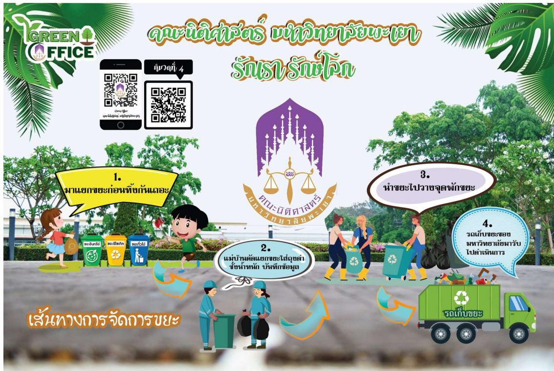
ภาพ 7 การรณรงค์สร้างจิตสำนึกการคัดแยกขยะผ่านสื่อออนไลน์

ได้ให้ความร่วมมือกับมหาวิทยาลัยเพื่อสนองนโยบาย ลดภาวะ โลกร้อน เพื่อมุ่งสู่การเป็น Green University ของมหาวิทยาลัยพะเยา โดยได้เน้นการสร้างจิตสำนึกและการมีส่วนร่วมของบุคลากรในองค์กรในเรื่องของการคัดแยกขยะ การลดขยะ รณรงค์ไม่ใช้กล่องโฟม ลดการใช้ถุงพลาสติกโดยใช้กระดาษแทน และ การใช้แก้วน้ำประจำตัว