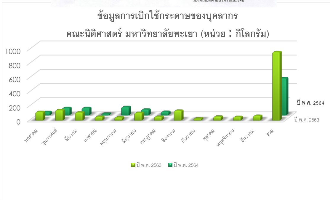
ภาพ 1 สถิติการใช้กระดาษ (หน่วย:กิโลกรัม) เปรียบเทียบ พ.ศ.2563 และ พ.ศ.2564