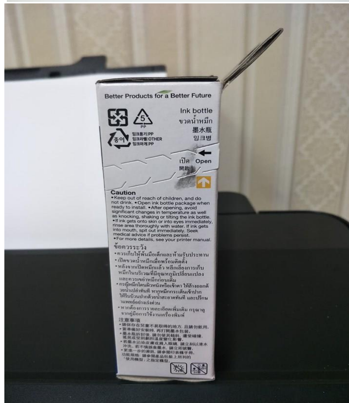
หมึกพิมพ์ของสำนักงานคณะนิติศาสตร์ ภายใต้ Concept ผลิตภัณฑ์ที่ดีกว่าเพื่ออนาคตที่ดีกว่า (Better Products for a Better Future)