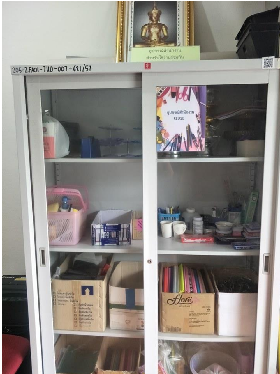
อุปกรณ์สำนักงานส่วนกลางสำหรับใช้งานร่วมกัน