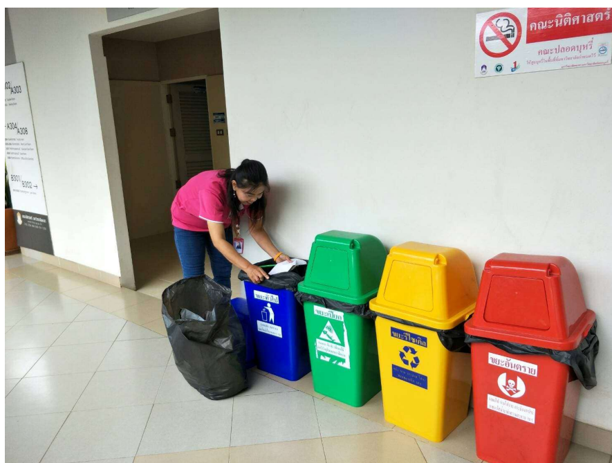
ภาพ 7 การตรวจสอบการทิ้งขยะ

3. มีการดำเนินการตรวจสอบความถูกต้องของการคัดแยกขยะ โดยแม่บ้านประจำอาคารจะทำการตรวจสอบความถูกต้องของการทิ้งขยะแต่ละประเภทในทุกๆ วัน