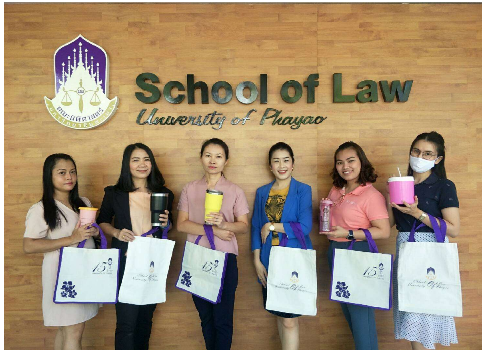
ภาพ 4 ธรรงค์ให้บุคลากรในสำนักงานใช้กระเป๋าและแก้วน้ำส่วนตัว