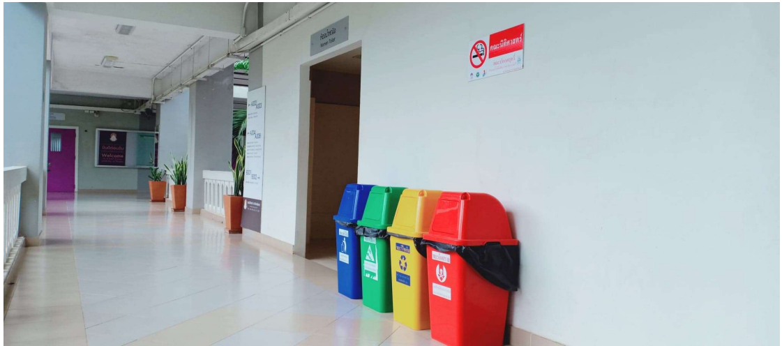
ภาพ 2 ถึงขยะแยกประเภทภายในอาคาร

1. ได้มีการวางจุดทิ้งขยะภายในอาคาร และติดป้ายบ่งชี้ประเภทการคัดแยกขยะ เพื่อสร้างจิตสำนึกของบุคลากรและการมีส่วนร่วมของผู้ที่มาใช้บริการ