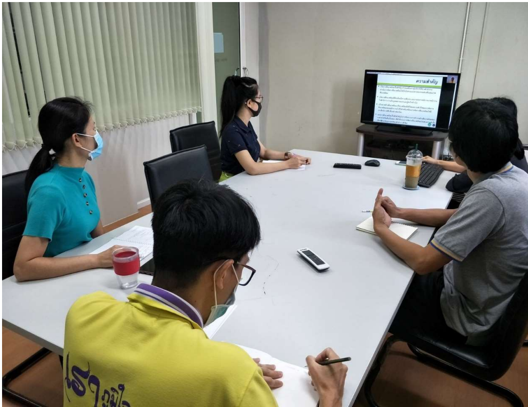
ภาพ 5 การอบรมให้ความรู้เรื่องการค้าแยกขยะให้กับบุคลากร