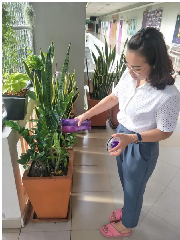
ภาพ 4-5 รณรงค์ให้บุคลากรใช้แก้วน้ำส่วนตัวและควรรดน้ำให้หมด หรือ หากน้ำเหลือควรใช้รดต้นไม้