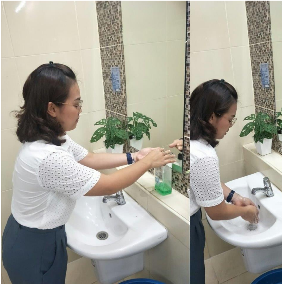
ภาพ 6 การล้างมือให้ใช้สบู่เหลวแทนสบู่ก้อน