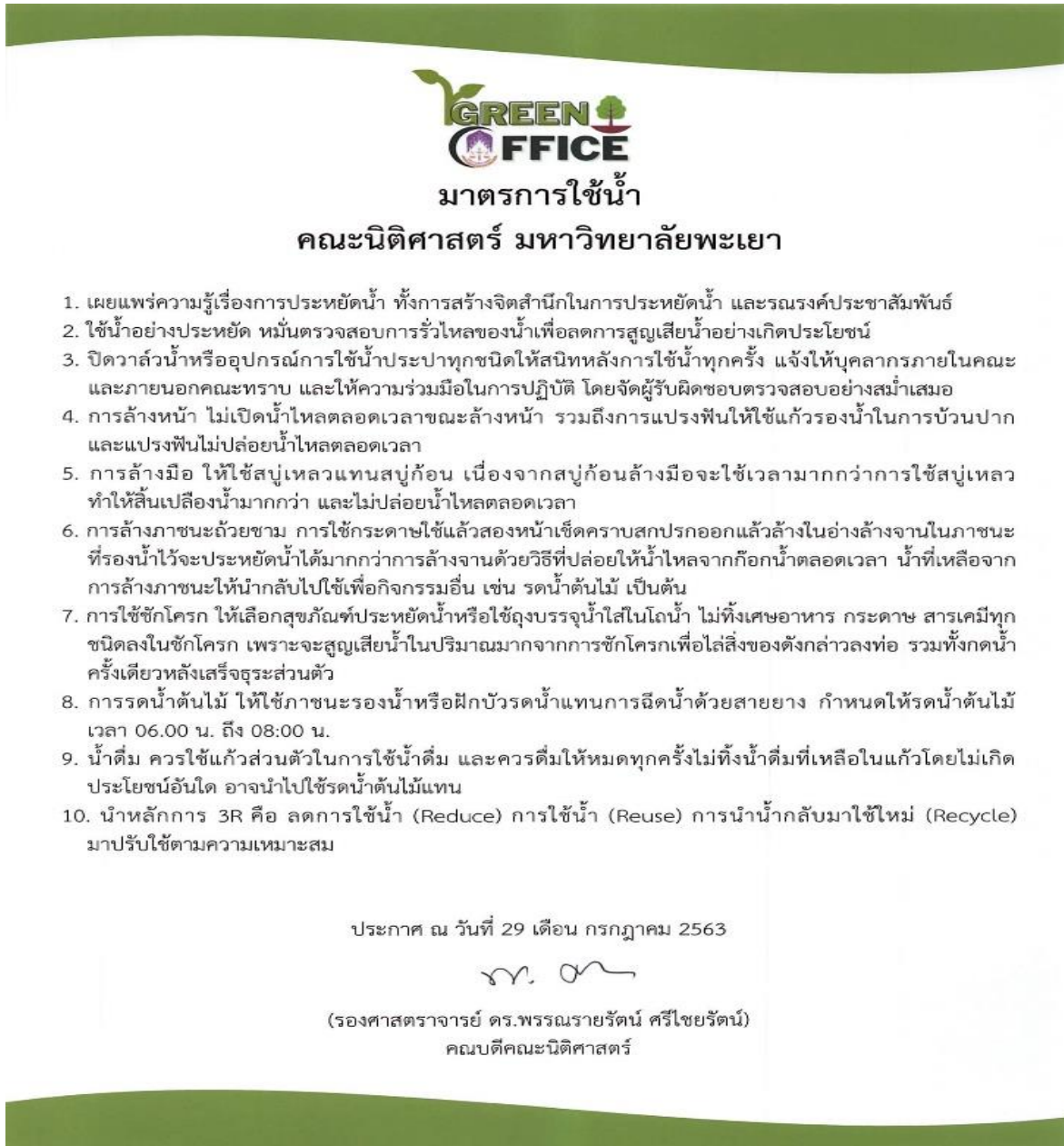
ภาพ 1 มาตรการใช้น้ำ คณะนิติศาสตร์ มหาวิทยาลัยพะเยา

คณะนิติศาสตร์ มหาวิทยาลัยพะเยา เห็นความสำคัญในการใช้น้ำอย่างประหยัด จึงได้กำหนดมาตรการใช้น้ำ และเผยแพร่รณรงค์ให้กับบุคลากรคณะนิติศาสตร์ทราบถึงการตระหนักรู้ถึงการประหยัดน้ำ ดังต่อไปนี้