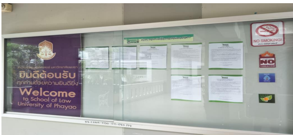
ภาพ 3 ประชาสัมพันธ์มาตรการใช้น้ำ ในบอร์ดประชาสัมพันธ์คณะนิติศาสตร์