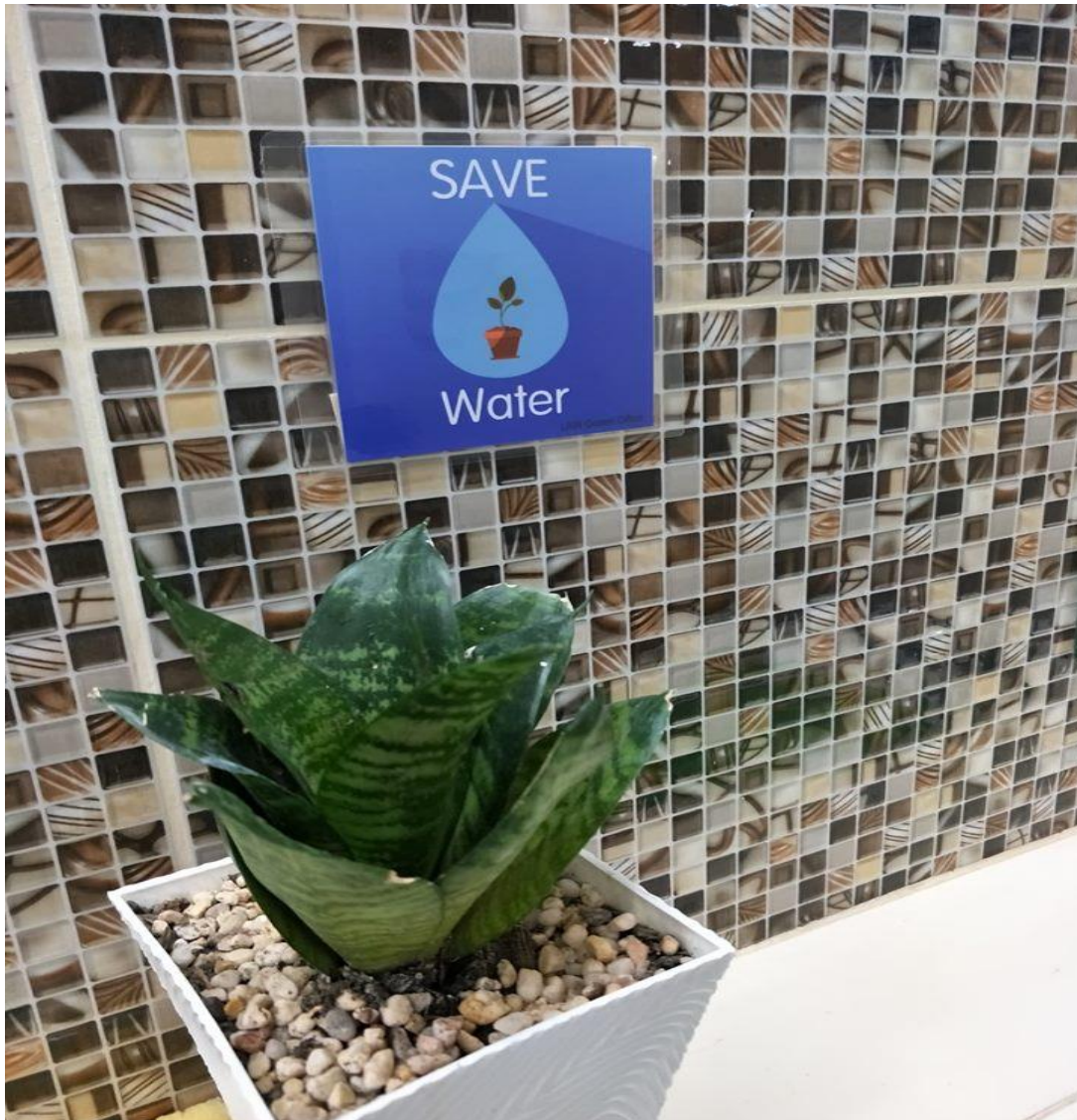
ภาพ 2 ประชาสัมพันธ์การประหยัดน้ำในห้องน้ำ ช-ญ คณะนิติศาสตร์