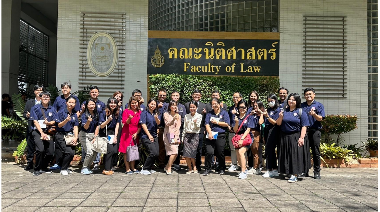
ภาพโครงการสัมมนาคณะนิติศาสตร์เพื่อจัดทำแผนยุทธศาสตร์ แผนพัฒนาและแผนปฏิบัติการคณะนิติศาสตร์