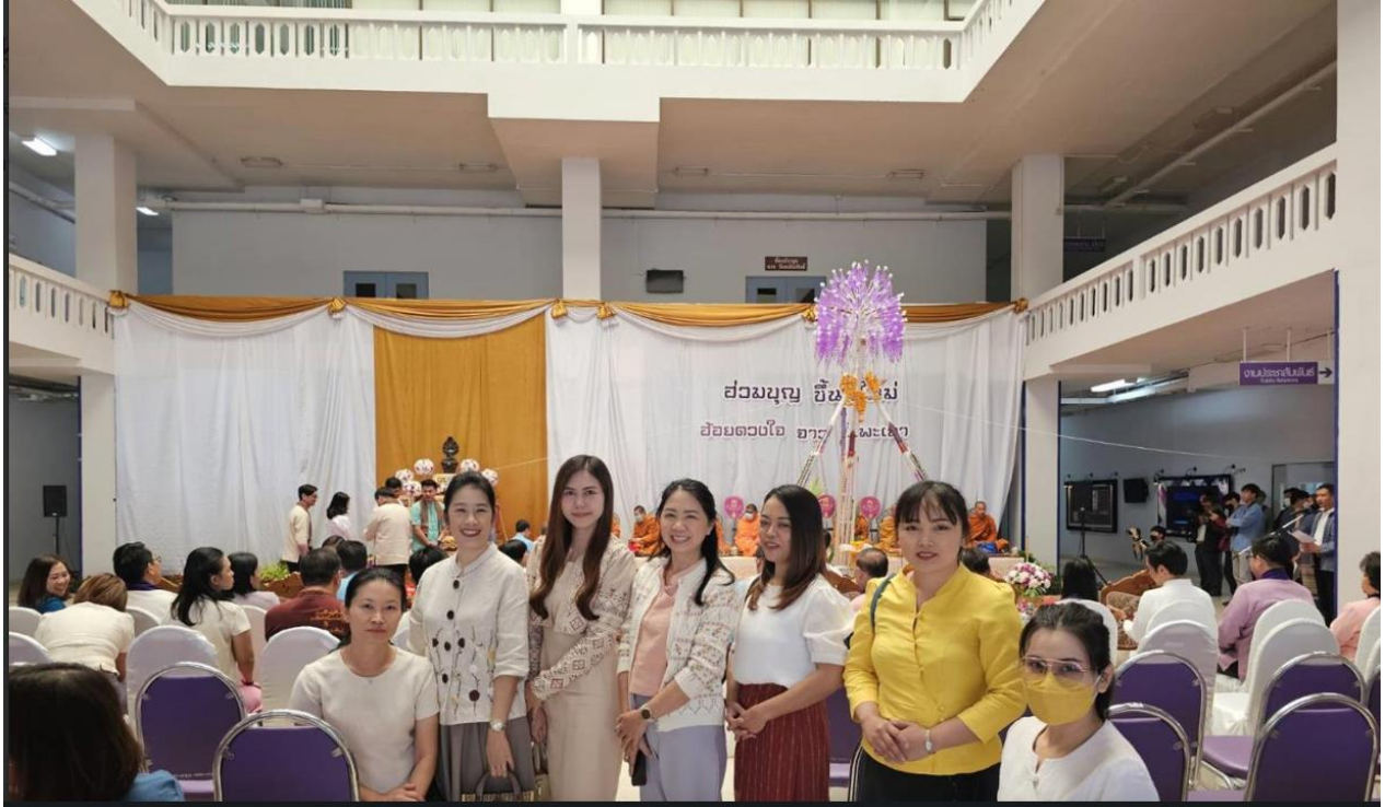
ภาพกิจกรรม พิธีทำบุญเนื่องในวันขึ้นปีใหม่ “ร่วมบุญ ขึ้นปีใหม่ อภัยดวงใจ จาว ม.พะเยา” ประจำปี 2567