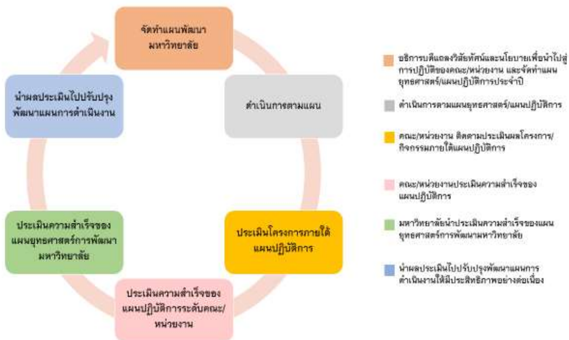
รูปที่ 1 ผังการประเมินความสำเร็จของแผนยุทธศาสตร์

แผนปฏิบัติการประจำปีงบประมาณ พ.ศ. 2567 มีวัตถุประสงค์เพื่อให้ทราบถึงความก้าวหน้าของการดำเนินงาน ปัญหา และอุปสรรค และเพื่อเป็นแนวทางในการปรับปรุงพัฒนามหาวิทยาลัยอย่างต่อเนื่อง รวมทั้งเพื่อนำประสบการณ์จากการทำงานไปกำหนดนโยบายการบริหารงานเพื่อพัฒนามหาวิทยาลัยให้เจริญก้าวหน้าและบรรลุวิสัยทัศน์ของอธิการบดีต่อไป โดยมีกระบวนการประเมินด้วยการรวบรวมข้อมูลและวิเคราะห์ข้อมูลผลการดำเนินงานทั้งในเชิงปริมาณและคุณภาพ โดยเปรียบเทียบค่าเป้าหมายและแผนการดำเนินงานกับผลการดำเนินงานและการเบิกจ่ายงบประมาณของทุกส่วนงานในมหาวิทยาลัยพะเยา เพื่อเสนอต่อคณะกรรมการบริหารมหาวิทยาลัย และคณะกรรมการสภามหาวิทยาลัยตามลำดับ ดังรูปแสดงผังการประเมินต่อไปนี้